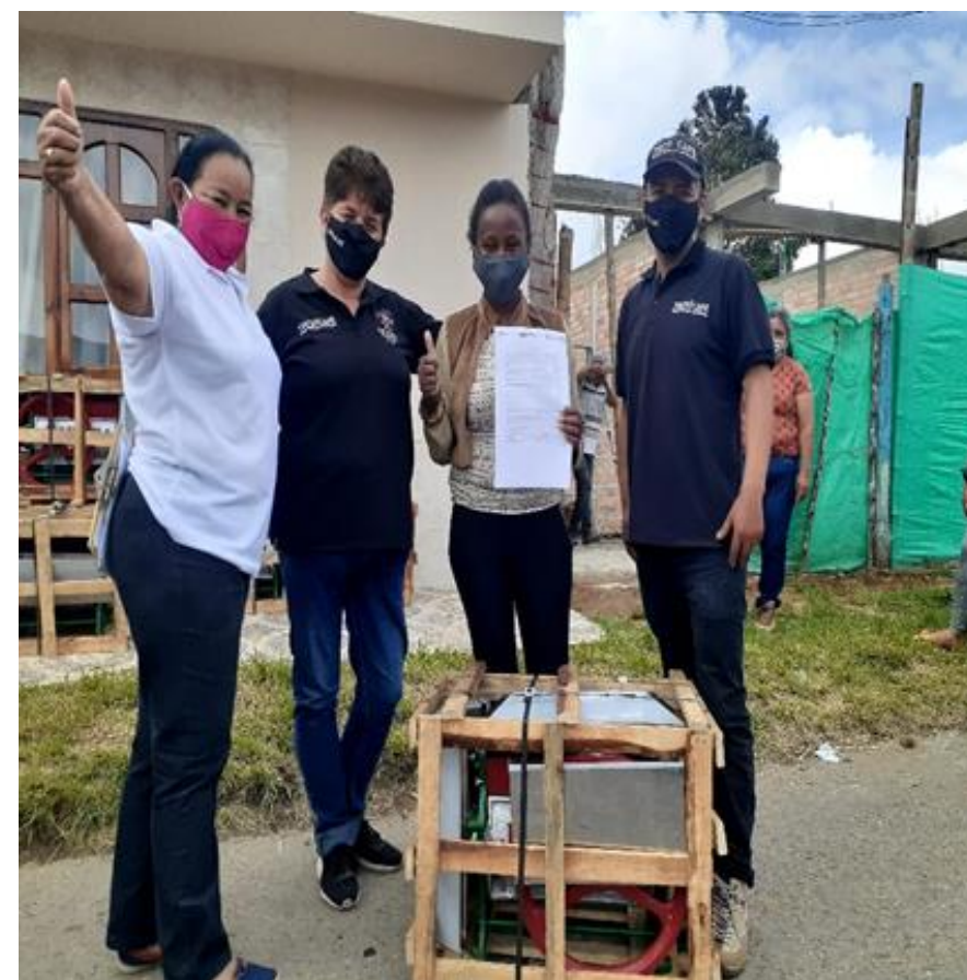
Acceso al financiamiento: Fondo Rotatorio