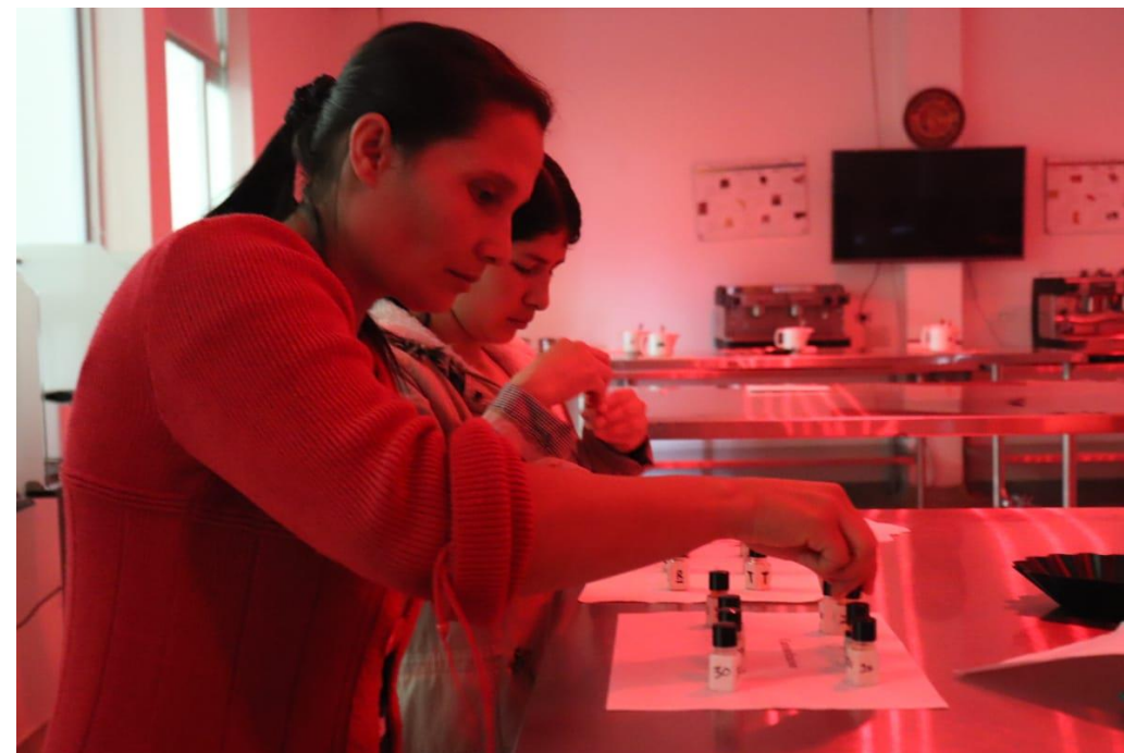
5 Productoras Certificadas Q Processing Nivel 2 – 3 Catadoras Q Grader