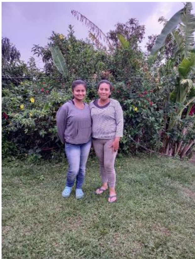
Fortalecimiento de la base social con nuevas generaciones