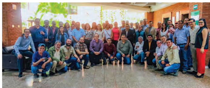
Reunión inicial con el equipo de expositores y conferencistas del XXIV Simposio Latinoamericano de Caficultura 2019