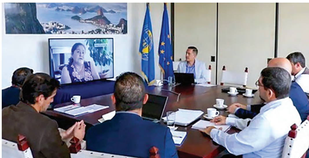
PROMECAFE en apoyo y coordinación de acción y resultados de PROCAGICA

El Coordinador de PROCAGICA presentó un resumen de los principales avances del PROCAGICA respecto a la lógica de intervención del programa considerando conceptos, enfoques, métodos y riesgos.