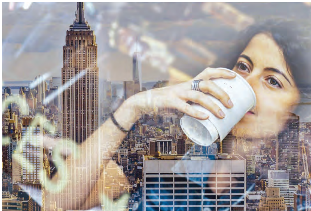
No hay como iniciar el día con una rica taza de café

Cada vez son más las investigaciones que contradicen el carácter supuestamente perjudicial de esta bebida. La última de ella ha sido realizada en una de las grandes universidades estadounidenses.