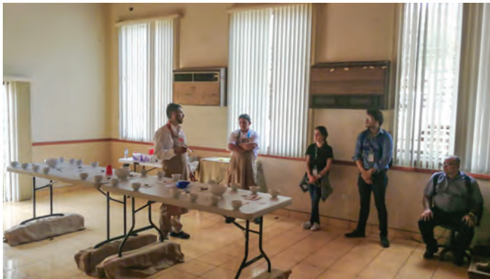
Estación 1. Procesos especiales de poscosecha y su influencia en la calidad