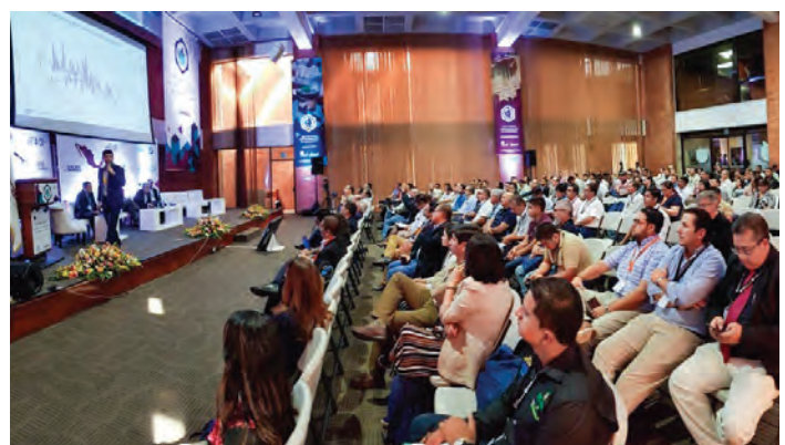
Sala de conferencias

Para PROMECAFE nuevamente ha sido un gusto poder contribuir año con año en el fortalecimiento e intercambio científico de sus instituciones y caficultores a nivel regional; les damos las gracias a todos por el esfuerzo realizado y esperamos nuevamente poder contar con sus participaciones en nuestra XXV Edición en el 2021.