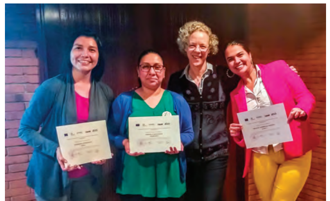
Identificando oportunidades para fortalecer la caficultura regional a través de NAMA Café