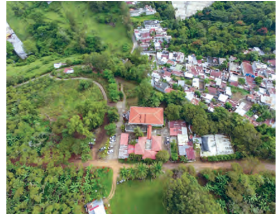
Gira de Campo a la Finca Las Flores, ANACAFE