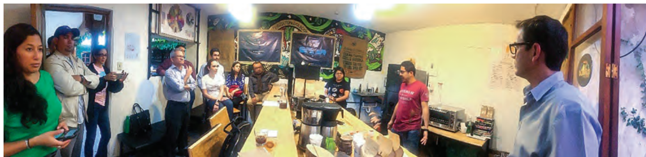
Técnicos de la región conociendo experiencias exitosas de Consumo Interno de Café con pequeños emprendedores en Antigua Guatemala.