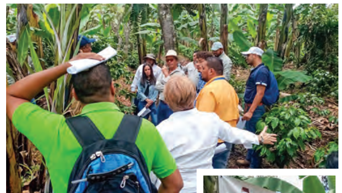
Estación 3. Evaluación de distanciamientos en cultivo de tejido H1; comparadas con H1 injertada y caturra como testigo y su efecto en la productividad