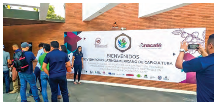
Inscripción y llegada de los participantes

a fin de fortalecer la búsqueda e implementación de posibles soluciones para hacer frente a los desafíos y oportunidades que permitan a cada eslabón de la cadena socialmente sostenible, competitiva y resiliente ante los diferentes cambios climáticos que afectan a la caficultura regional.