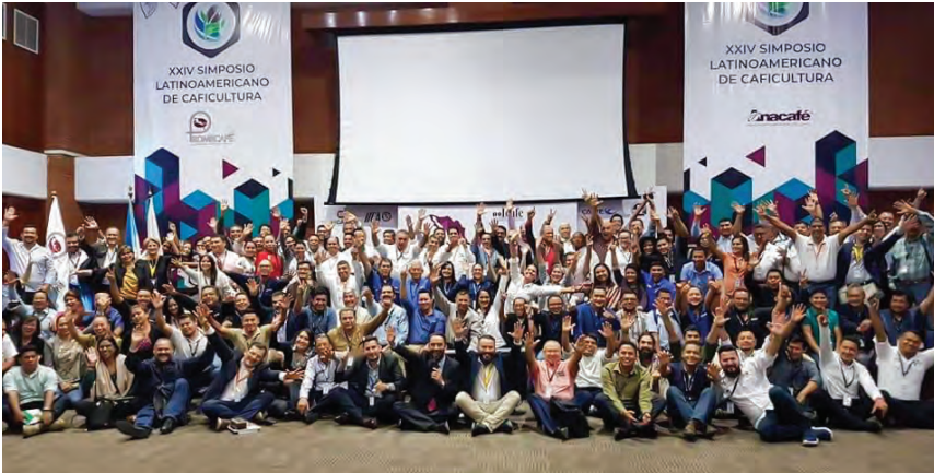
Cierre de conferencias y presentaciones del XXIV Simposio Latinoamericano de Caficultura 2019