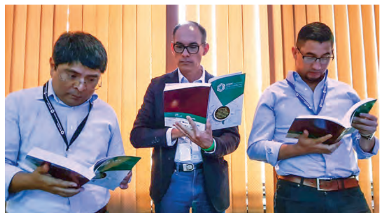
Entrega de Memoria del Simposio a los conferencistas y expositores