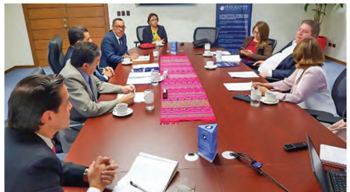
Reunión de Coordinación con el Ministro de Agricultura de El Salvador y Presidente Pro-Témpore de PROMECAFE