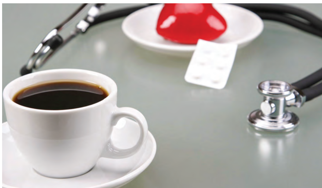
El café mejora nuestra salud cardíaca

Actualmente, como han señalado las investigaciones realizadas en el programa canadiense Motherisk, los datos no son concluyentes en lo que respecta al consumo de cafeína entre embarazadas, ya que durante mucho tiempo se ha pensado podía aumentar el riesgo de aborto espontáneo, lo que lleva a la agencia a recordar que nunca deben tomarse más de dos. En lo que respecta a los niños, la mayor parte de expertos recuerdan que la cafeína estimula el sistema nervioso central, por lo que puede provocar malestares gastrointestinales o inquietud. Como ha señalado Jennifer L. Temple, profesora asociada de la Escuela de Salud Pública de la Universidad