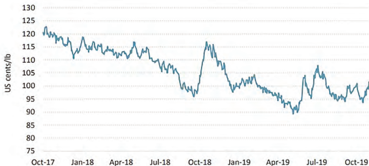
Gráfico 1: Precio indicativo compuesto diario de la OIC

Con base en las estadísticas publicadas por la Organización Internacional del Café (OIC), se presenta a continuación información actualizada sobre el contexto de la caficultura mundial, en la producción, exportaciones y consumo mundial de café.