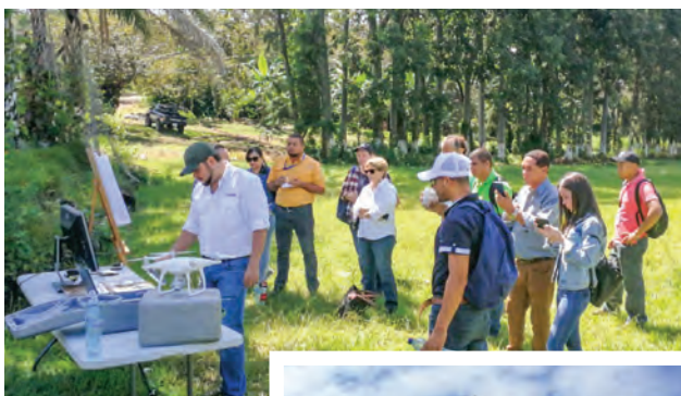
Estación 2. Herramientas tecnológicas aliadas a la producción. Uso de drones