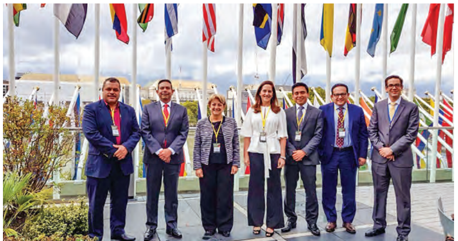
PROMECAFE realiza gestiones al más alto nivel en la OIC en la búsqueda de soluciones a la crisis de bajos precios que afecta a los productores en la región.