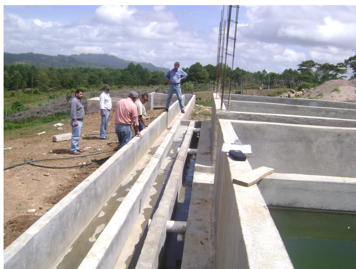
Progreso de la obra civil de una de las plantas de beneficiado financiadas por el proyecto. Beneficio modelo 5 para procesar 5 000 quintales de café oro/año. Municipio de San Luis, Comayagua.

Actualmente se llevan a cabo una serie de tres talleres interactivos donde han participado 115 productores de café, beneficiarios del proyecto; 30 extensionistas, especialistas en beneficiado y coordinadores regionales del IHCAFE, así como funcionarios de BANADESA, de CONACAFE, y de la Unidad Técnica IICA/PROMECAFE – IHCAFE. Estos eventos, realizados con el apoyo de una especialista en comunicación educativa, se está tratando de establecer una comunicación recíproca entre los participantes, tanto en tecnología moderna de beneficiado que se transfiera a los productores, como de la sabiduría convencional de ellos sobre esa materia hacia los técnicos del proyecto; conocer sobre el avance en la ejecución de los planes de inversión con financiamiento del proyecto y las dificultades